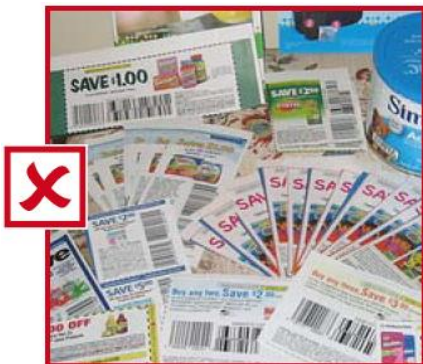
Bon de réduction