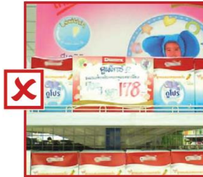
Réduction de prix