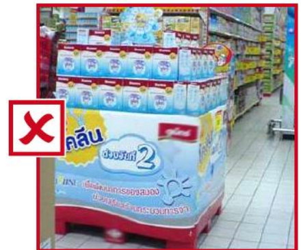
Mise en avant