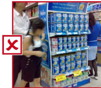
Tête de gondole